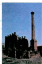
Provincia Regionale di Catania . Museo Tattile: veduta esterna.