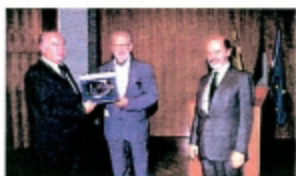
Premiazione del 1 o Classificato.